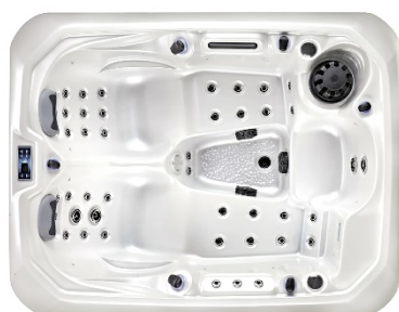
W04 - Perlweiss