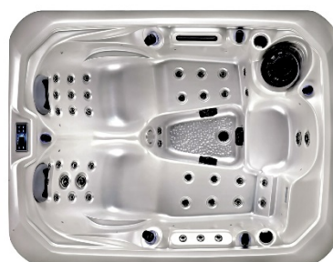
W21 – Silber marmoriert